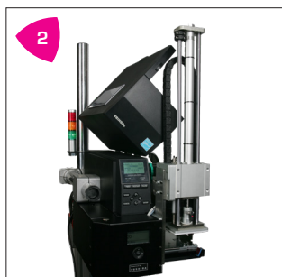
2 Compact, sans danger et facilement accessible pour l'opérateur.