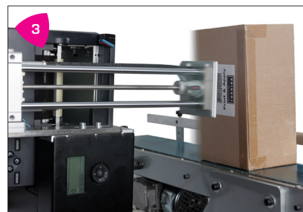
3 Polyvalent, appliquer des étiquettes sur le haut, le bas ou le côté dans l'angle de rotation.